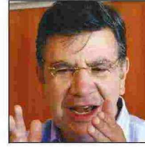
Educación Joaquín Lavín

Militante UDI, 32 años y economista de la Universidad Católica son algunos rasgos que definen a Kast. Es doctor en Políticas Públicas de la Universidad de Harvard. Es el miembro más joven del gabinete.