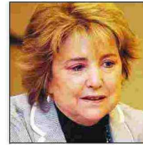
Vivienda Magdalena Matte