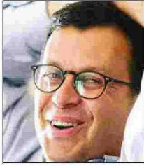
Interior Rodrigo Hinzpeter

Es abogado, milita en RN y es el brazo derecho del Presidente electo. El hombre de lentes redondos tiene 44 años y fue coordinador general de las dos campañas de Piñera. Dentro de su partido lo definen como “la máquina política”.