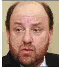
Relaciones Exteriores Alfredo Moreno

Es abogado, milita en RN y es el brazo derecho del Presidente electo. El hombre de lentes redondos tiene 44 años y fue coordinador general de las dos campañas de Piñera. Dentro de su partido lo definen como “la máquina política”.