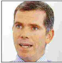
Justicia Felipe Bulnes

Fue candidato presidencial en 1999 y 2005. Alcalde de Las Condes y Santiago, donde creo una playa. Su última disputa fue ante Francisco Chahuán en las senatoriales por la Quinta Costa. Es ingeniero comercial de la UC y tiene 57 años.