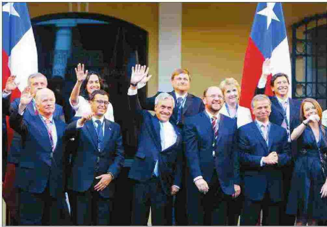
Piñera y su vestón desguañangado, como decían los antiguos.