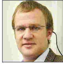
Mideplan Felipe Kast

Ingeniero comercial. Con 55 años tiene un máster y estudios de doctorado en la Universidad de Chicago. ¿Trayectoria? Director del Banco Santander y del Grupo Mall Plaza. Es académico del Instituto de Economía de su casa de estudios, la UC.