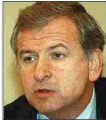
Hacienda Felipe Larraín

Abogado de la Universidad de Chile. El mayor de la camada (63 años) fue la sorpresa porque hasta ayer militaba en la DC. Trabajó como ministro de Defensa y de Vivienda durante el mandato de Ricardo Lagos.