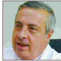
Salud Jaime Mañalich

Tiene 40 años. Abogado y académico de la UC, máster en Derecho de la Universidad de Harvard y profesor de la Adolfo Ibáñez. Fue consejero del Colegio de Abogados y es coordinador de la comisión de Justicia del grupo Tantaucó.